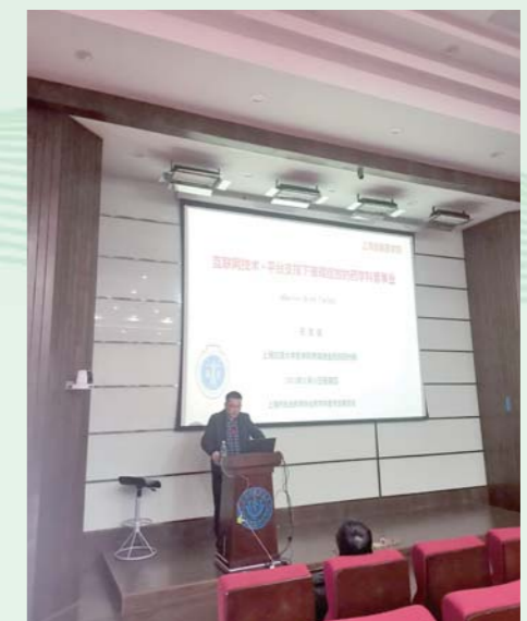
石浩强副会长为健康学院学生授课