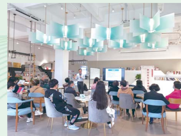
药学科普专委会举办科普讲座